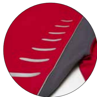
Motiv „Brush“ Art-Nr. 9901401 Maße: ca. 25 x 9,5 cm