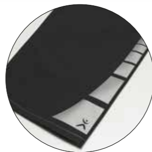
Motiv „Square“ Art-Nr. 9901402 Maße: ca. 25 x 7,5 cm