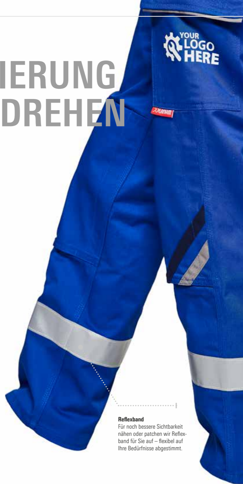
Reflexband Für noch bessere Sichtbarkeit nähen oder patchen wir Reflexband für Sie auf – flexibel auf Ihre Bedürfnisse abgestimmt.

Wichtiger Hinweis: Das Aufbringen zusätzlicher Reflexstreifen führt nicht dazu, dass entsprechende Kleidungsstücke als Warnschutzbekleidung gelten.