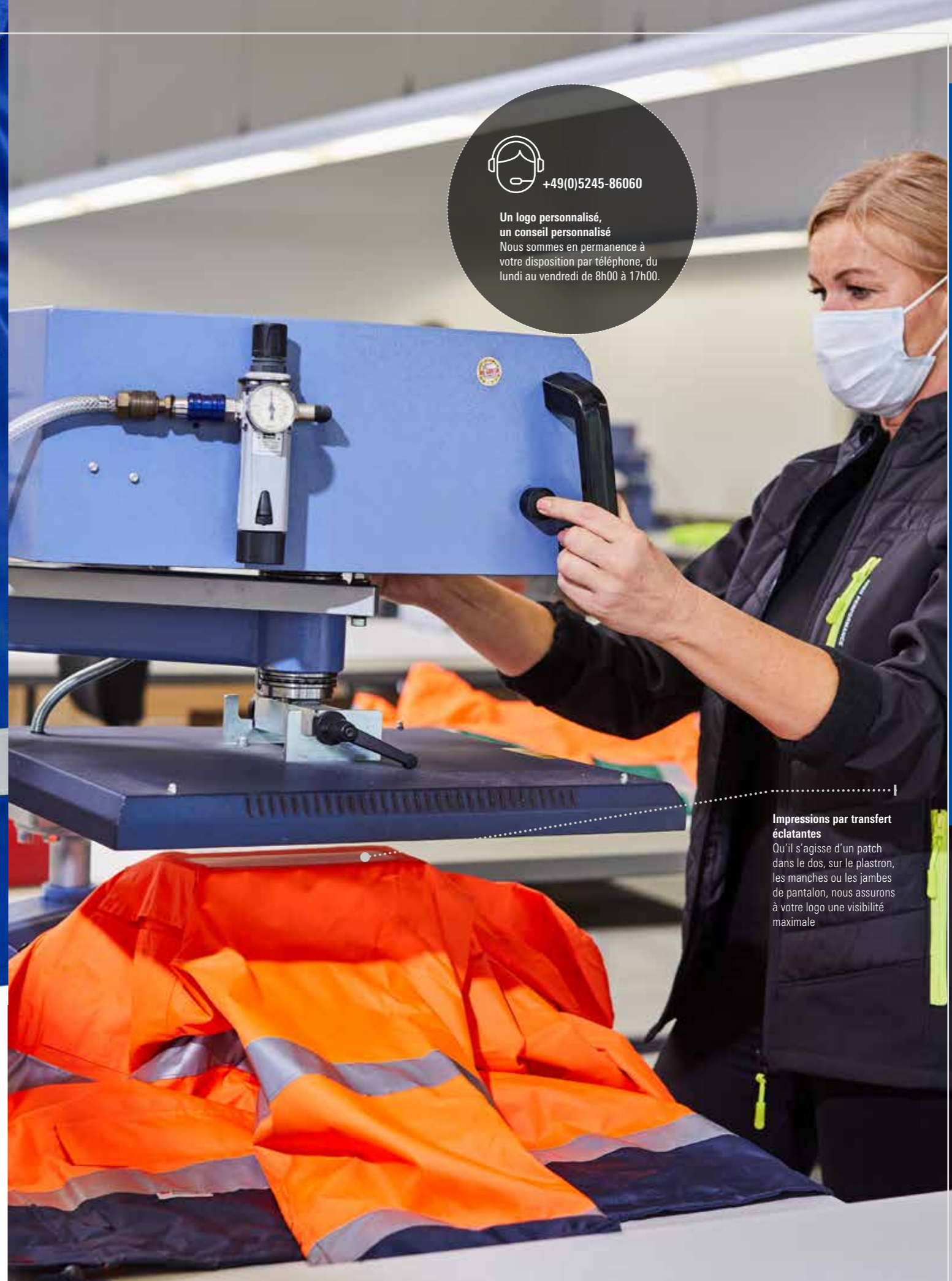
Impressions par transfert éclatantes Qu'il s'agisse d'un patch dans le dos, sur le plastron, les manches ou les jambes de pantalon, nous assurons à votre logo une visibilité maximale