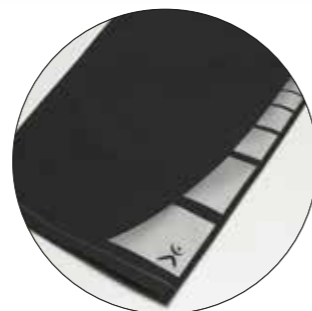
Motif „Square“ art. n° 9901402 Dimensions : ca. 25 x 7,5 cm