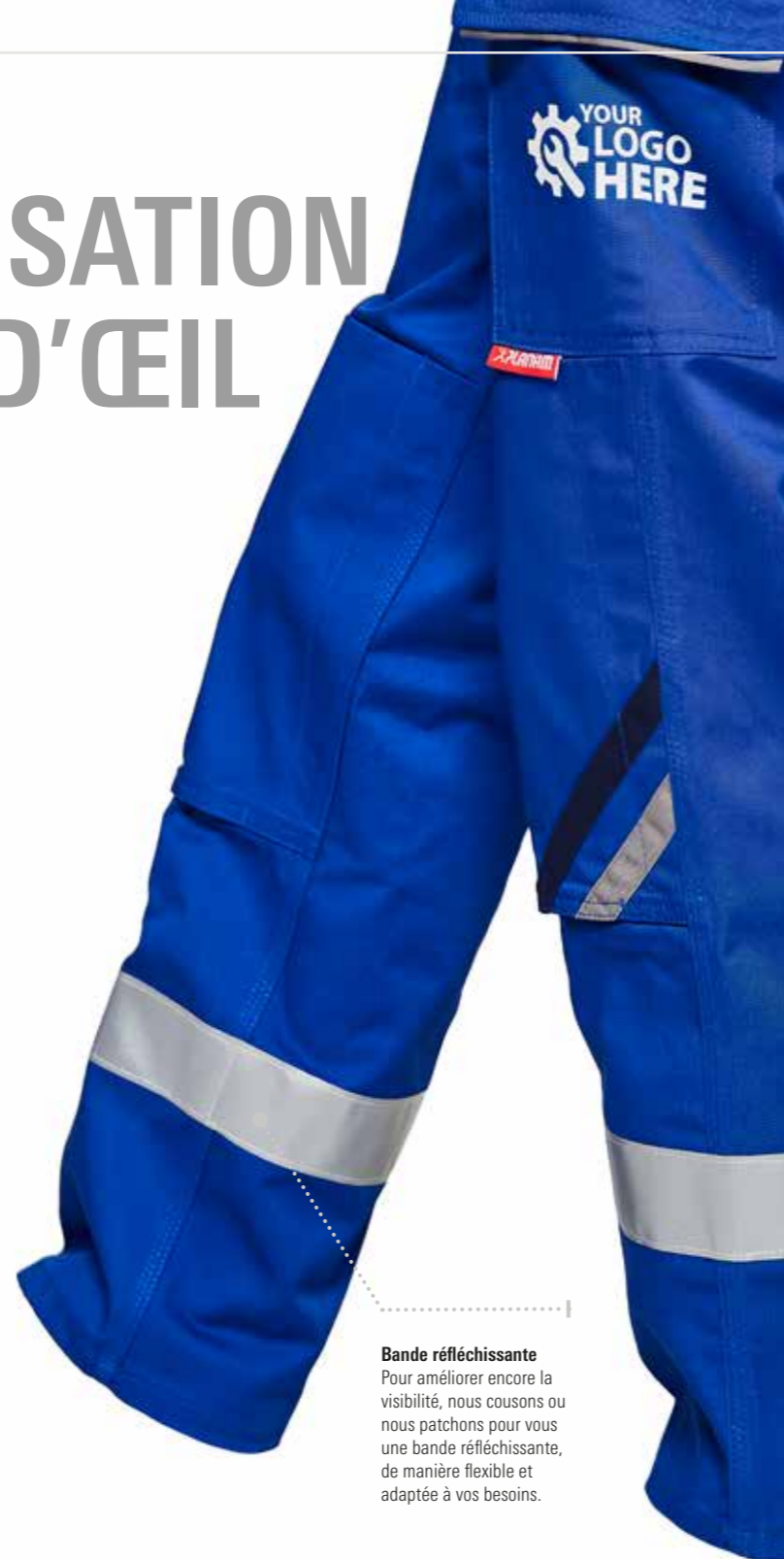
Bande réfléchissante Pour améliorer encore la visibilité, nous cousons ou nous patchons pour vous une bande réfléchissante, de manière flexible et adaptée à vos besoins.

Remarque importante : l'application de bandes réfléchissantes supplémentaires ne permet pas de considérer les vêtements correspondants comme des vêtements à haute visibilité.